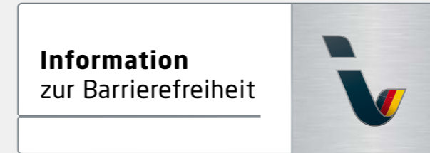
Logo »Information zur Barrierefreiheit«