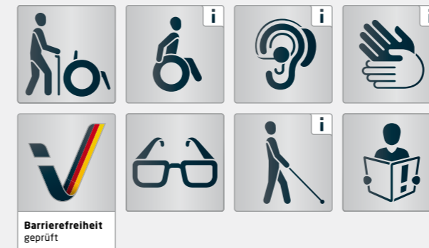
Piktogramme für verschiedene Personengruppen