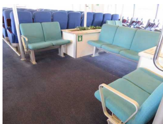
Vorgesehener Platz für Rollstuhlfahrer