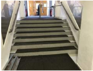
Treppe auf dem Weg zur Bahn