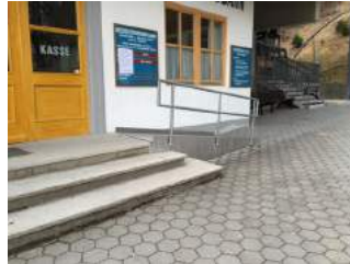
Weg zum Eingang