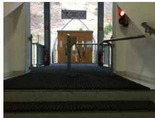
Weg zur Bahn