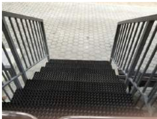
Treppe auf dem Weg vom Ausstieg aus der Seilbahn zum Parkplatz