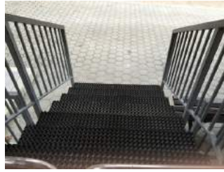
Weg vom Ausstieg Talstation zum Parkplatz