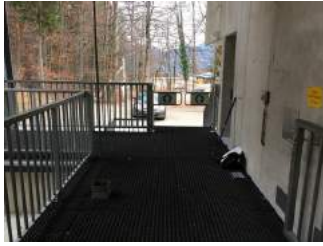
Weg vom Ausstieg Talstation zum Parkplatz