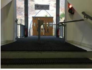
Zugang zur Bahn