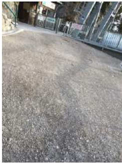
Weg zur Aussichtsplattform