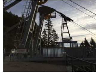
Ein- und Ausstiegsbereich Bergstation