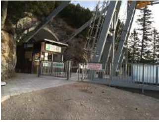
Ein- und Ausgang Bergstation