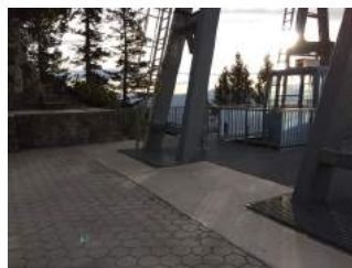
Weg Seilbahn Bergstation und Ein- und Ausgang