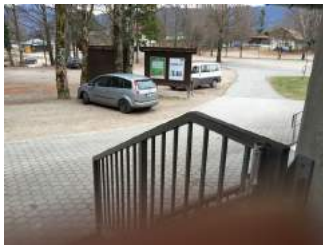
Weg vom Ausstieg Talstation zum Parkplatz