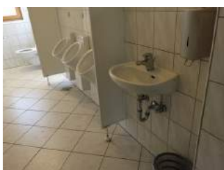
Waschbecken Vorraum Herrentoilette