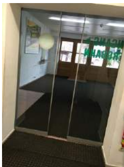
Tür auf dem Weg zur Bahn