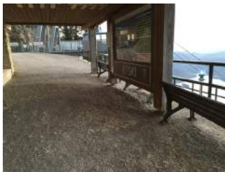
Weg zur Aussichtsplattform