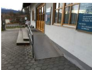
Rampe zum Eingang