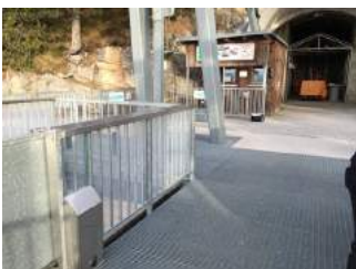
Weg Seilbahn Bergstation und Ein- und Ausgang