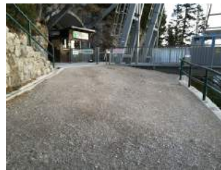
Weg zur Aussichtsplattform