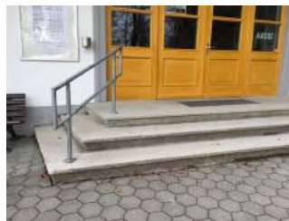
Treppe zum Eingang