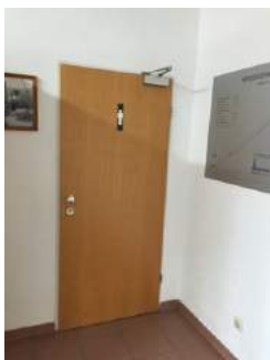
Tür Vorraum Herrentoilette