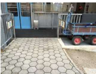
Zugang zur Bahn über Nebeneingang