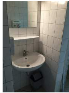
Waschbecken im Vorraum Damentoilette