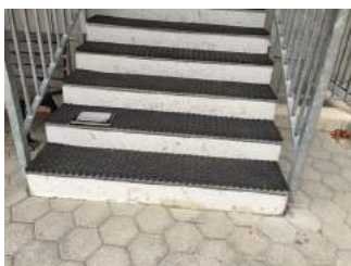
Treppe auf dem Weg vom Ausstieg aus der Seilbahn zum Parkplatz