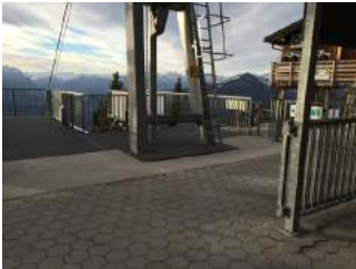
Ein- und Ausstiegsbereich Bergstation