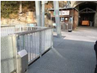
Ein- und Ausstiegsbereich Bergstation