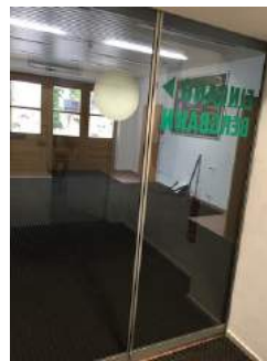
Tür auf dem Weg zur Bahn