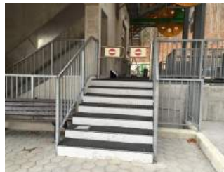
Treppe auf dem Weg vom Ausstieg aus der Seilbahn zum Parkplatz