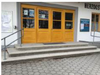
Treppe zum Eingang