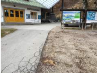
Weg vom Parkplatz zum Eingang