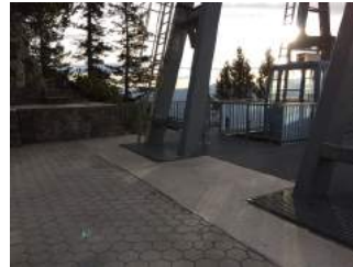
Ein- und Ausstiegsbereich Bergstation