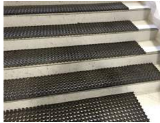
Treppe auf dem Weg zur Bahn