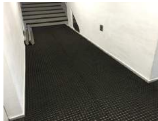
Weg zur Bahn