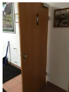
Tür zum Vorraum Damentoilette