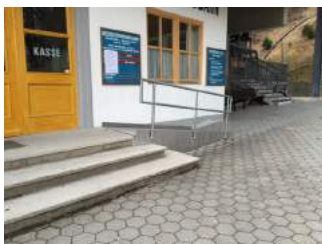
Treppe und Rampe zum Eingang