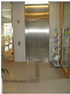
Leitstreifen in Lobby