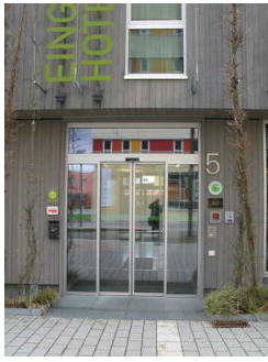
Haupteingang mit taktilem Leistsystem