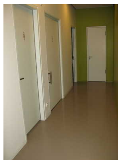
Kurzer Flur zum öffentlichen WC