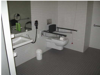
Sanitärraum Zimmer 101