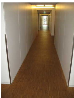
Flure zu den Zimmern