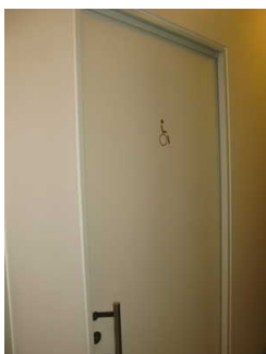
Tür zum öffentlichen WC