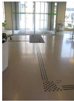
Leitstreifen in Lobby