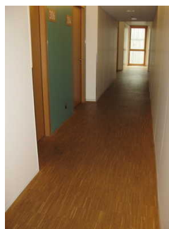
Flure zu den Zimmern