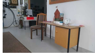
Tresen im Burgmuseum

Der Schalter/Tresen/die Kasse ist von der Eingangstür aus direkt sichtbar.