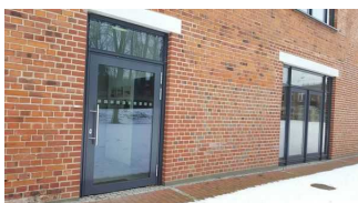
Seiteneingang in das Burgmuseum