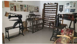
Geschichte der Schuster