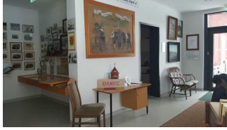
Kasse des Burgmuseums