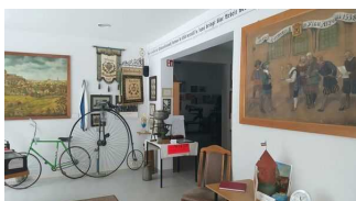
Weg in die Ausstellungsräume