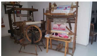
Geschichte der Weber