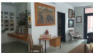
Weg von der Eingangstür zur Kasse