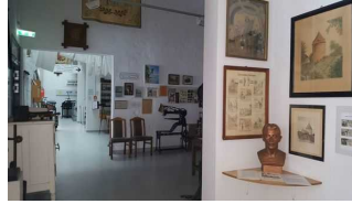
Blick in den unteren Ausstellungsraum

Informationen zu den Exponaten werden schriftlich vermittelt. Es gibt akustische Informationen zu den Exponaten.