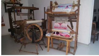
Geschichte der Weber