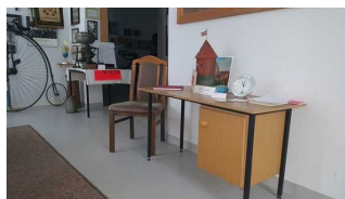
Tresen im Burgmuseum

Der Schalter/Tresen/die Kasse ist hell ausgeleuchtet.