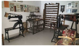
Geschichte der Schuster