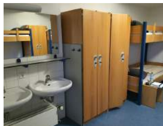
Zimmer JH Nürnberg