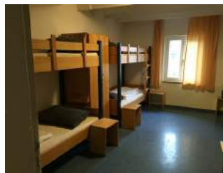
Zimmer JH Nürnberg