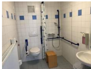
Sanitärraum für Zimmer / Öffentliche Toilette