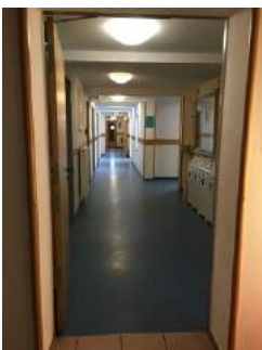
Weg zu Zimmer JH Oberammergau