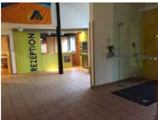
Weg Eingang - Rezeption