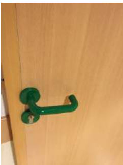
Tür Tagungsraum Memmingen