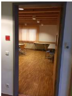
Eingang Tagungsraum Ottobeuren