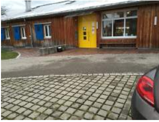
Weg Parkplatz - Eingang