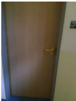
Tür Zimmer JH Oberammergau