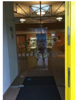
Zweite Eingangstür mit Windfang