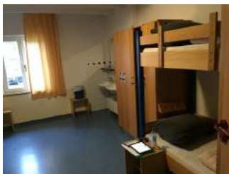
Zimmer JH Nürnberg