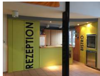
Säule vor Rezeption