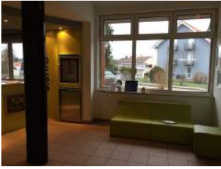
Sitzecke bei Rezeption

Bewegungsfläche vor der Rezeption / Kasse - Breite: 300 cm