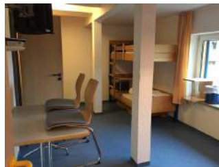
Zimmer JH Oberammergau