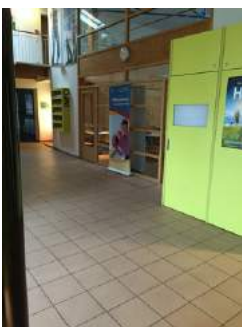
Weg Rezeption - Speiseraum