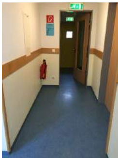
Tür auf dem Weg zu Zimmer JH Oberammergau