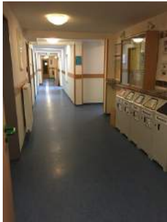
Weg Zimmer JH Oberammergau - Sanitärraum