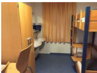
Tür Zimmer JH Eichstätt