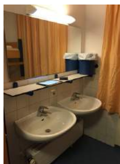
Waschbecken Zimmer JH Eichstätt