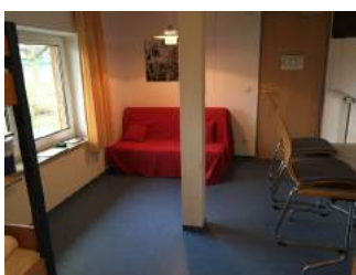
Zimmer JH Oberammergau mit Säule