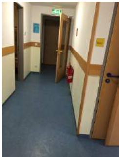
Weg Zimmer JH Oberammergau - Sanitärraum