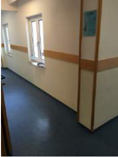
Weg Zimmer JH Eichstätt - Sanitärraum