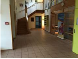
Weg Rezeption - Zimmer JH Eichstätt