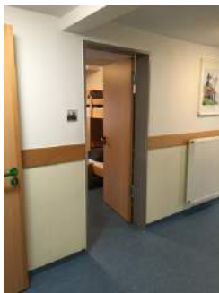
Tür Zimmer JH Nürnberg