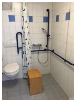
Dusche + Toilette