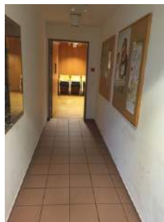
Weg zu Tagungsräumen