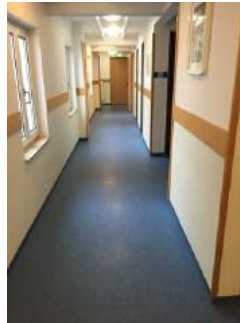
Weg Zimmer JH Oberammergau - Sanitärraum