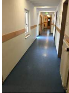
Weg Zimmer JH Eichstätt - Sanitärraum