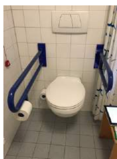
Toilette mit Haltegriffen