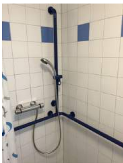
Duscharmatur + Haltegriffe