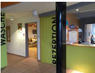
Weg zu Tagungsräumen