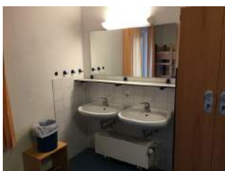
Waschbecken Zimmer JH Nürnberg