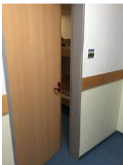
Tür Zimmer JH Eichstätt