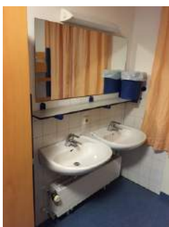
Waschbecken Zimmer JH Eichstätt