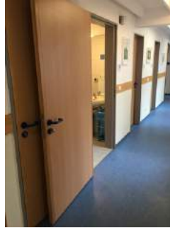
Weg Zimmer JH Eichstätt - Sanitärraum