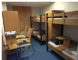
Zimmer JH Eichstätt